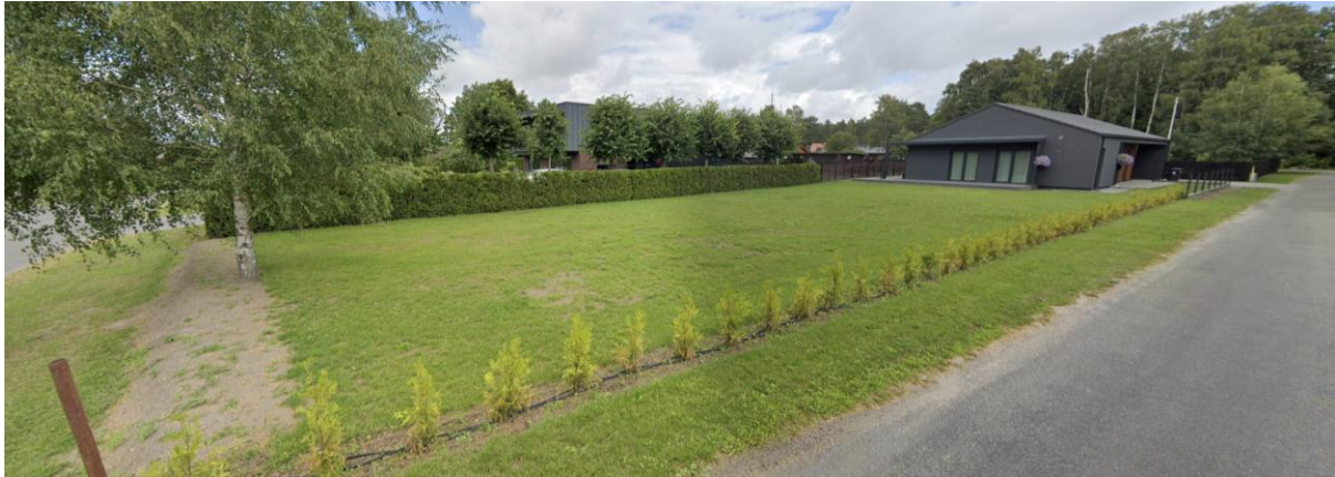
Joonis 2 Vaade Mesika tn 3 kinnistule