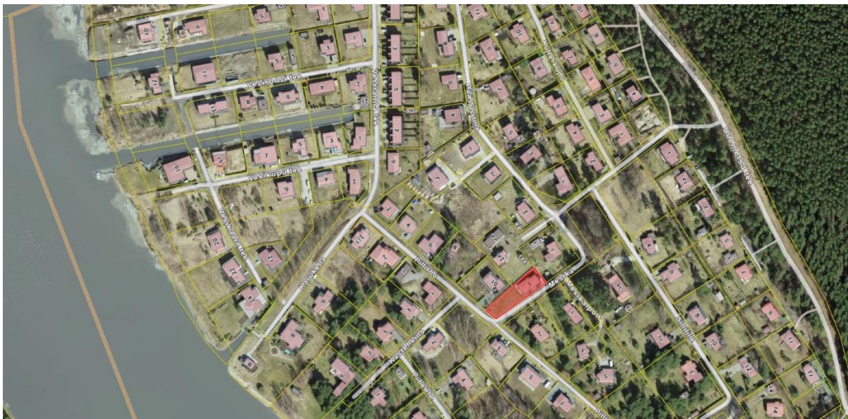
Joonis 3 Tammiste elamupiirkond

Mesika tn 3 kinnistu on osa Tammiste elamupiirkonnast, mis koosneb valdavalt üksiklamutest. Peamine osa hoonestusest paikneb olemasolevate teede ääres. Sõltuvalt krundist osa krunte hoonestatud ühe põhihoonega, osadel on ka abihoone. Tulenevalt Mesika tn 3 kinnistu suhtelisest väiksusest ja erandlikust kujust on alale abihoone paigutamiseks suhteliselt vähe võimalusi, mistõttu näeb käesolev detailplaneering abihoone asukohaks ette Pilliroo ja Mesika tänava nurga. Põhjalikum kaalutlus on antud seletuskirja p 6 all.